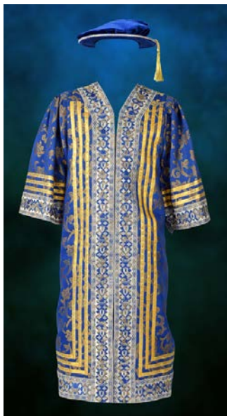
Jubah Pro-Canselor (I)