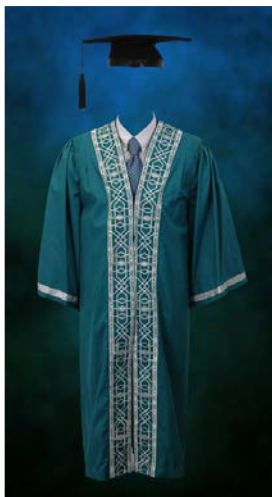
Jubah Graduan Sarjana Muda