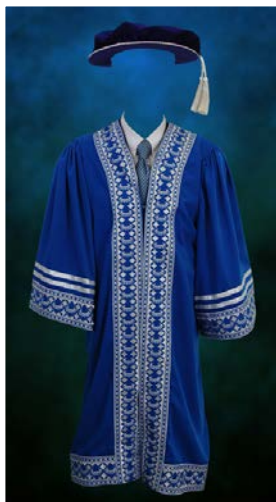
Jubah Ahli Senat Universiti