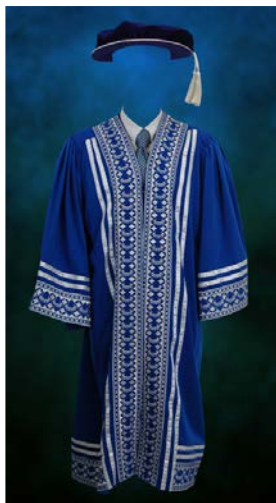
Jubah Ahli Lembaga Pengarah Universiti