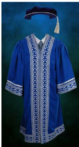
Jubah Pensyarah Universiti

Jubah Ahli Lembaga Pengarah Universiti, Pegawai Utama Universiti, ahli senat dan juga pensyarah adalah berwarna biru cerah dan bersulam di bahagian lengan, lapel dan kaki. Manakala warna sulaman pula adalah sama dengan jubah Menteri Pengajian Tinggi, Pengerusi Lembaga Pengarah Universiti dan Naib Canselor.