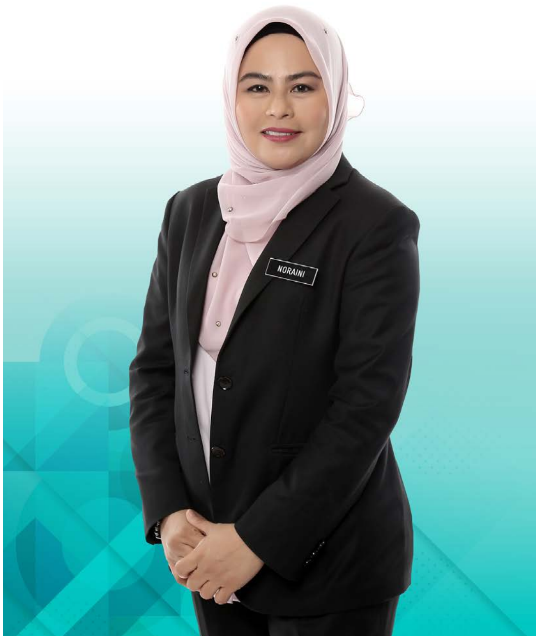
MENTERI PENGAJIAN TINGGI YB DATUK SERI DR. NORAINI BINTI AHMAD DSAP., DMSM., DGSM.