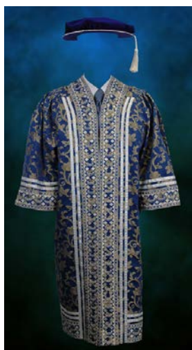
Jubah Pengerusi Lembaga Pengarah Universiti