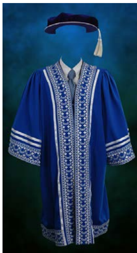
Jubah Pegawai Utama Universiti