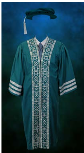
Jubah Graduan Doktor Falsafah