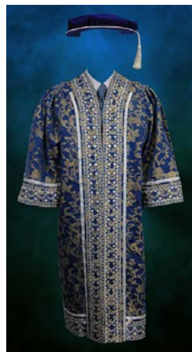
Jubah Penerima Ijazah Kehormat

Jubah Pro-Canselor, Pengerusi Lembaga Pengarah Universiti, Naib Canselor dan penerima Ijazah Kehormat diperbuat daripada kain broked berwarna biru dan bersulam benang perak di bahagian lengan, lapel dan kaki. Jubah Pro-Canselor (I) bersulam benang kuning di bahagian lengan, lapel dan kaki. Sulaman dan jalur pada jubah berwarna perak sebagai mewakili warna kejuruteraan dan teknologi. Manakala corak sulaman pada lapel melambangkan ciri-ciri keilmuan dan kejuruteraan.