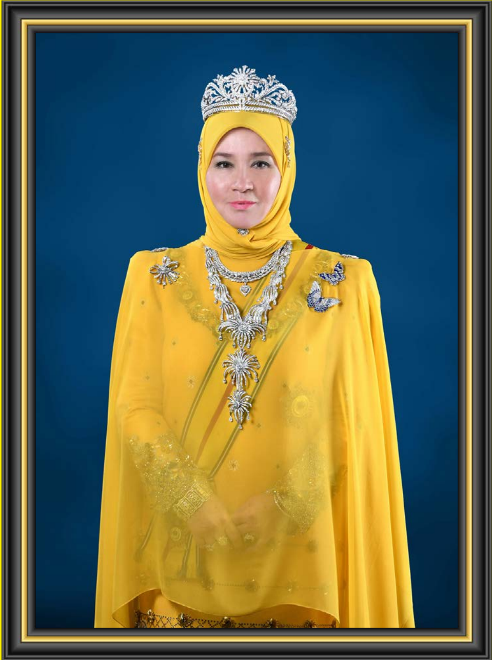
KEBAWAH DULI YANG MAHA MULIA SERI PADUKA BAGINDA RAJA PERMAISURI AGONG TUNKU HAJAH AZIZAH AMINAH MAIMUNAH ISKANDARIAH BINTI ALMARHUM AL-MUTAWAKKIL ALALLAH SULTAN ISKANDAR AL-HAJ D.K., D.M.N., S.S.A.P., S.I.M.P., D.K. (Johor)., S.P.M.J., D.K. (Brunei).