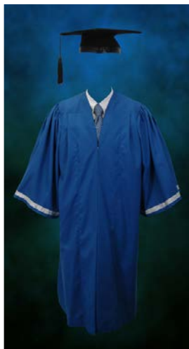
Jubah Graduan Diploma

Warna asas bagi jubah graduan doktor falsafah, sarjana dan sarjana muda adalah warna hijau firus. Manakala jubah graduan diploma pula berwarna biru. Semua jubah mempunyai sulaman bermotifkan logo UMP pada lapel kecuali jubah graduan diploma tiada sulaman.