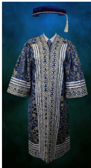
Jubah Pro-Canselor (II)