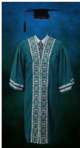
Jubah Graduan Sarjana